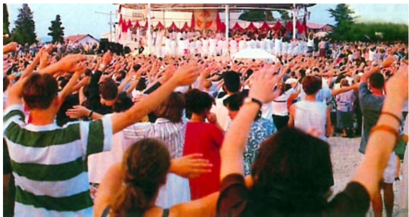
Festival Internacional de la Juventud 1999 celebrado en Medjugorje