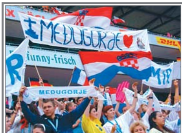
Jóvenes de la parroquia de Medjugorje, en la JMJ de Colonia.