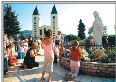
Imagen de la Virgen ante la parroquia de Santiago Apóstol.

explicar ni con las mil palabras del dicho. Medjugorje ofrece al peregrino, entre otras muchas cosas, imágenes tan elocuentes como éstas.