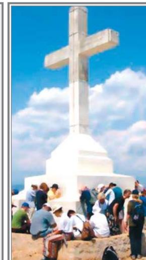
Una enorme cruz de hormigón domina el valle desde el Krizevac; el Podbro; y ante la parroquia.