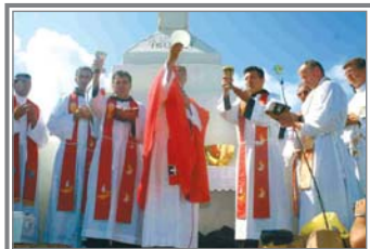
Celebración eucarística en el Krizevac o Monte de la Cruz; comienza la subida al Podbro o Loma de las apariciones; Via Crucis situado en la parte posterior de Santiago Apóstol.