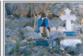
"Orar con el corazón": todos los peregrinos encuentran un momento para orar en alguno de los muchos lugares que invitan a ello en los alrededores de Medjugorje.