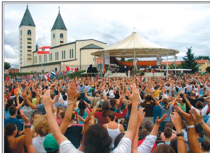
Mladifest o Encuentro Internacional de Oración de Jóvenes, la primera semana de agosto, en Medjugorje.