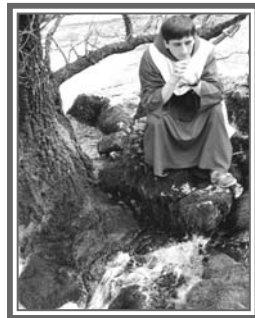
Imágenes de los ermitaños eucarísticos en distintos lugares de la zona.

“Medjugorje, a mi modo de ver las cosas, es el modelo de parroquia que debería tener todo párroco. Pero no sólo el párroco, sino la gente, que a la vez es tan ferviente, ya que no sólo van a misa o a los actos de piedad de los peregrinos, sino que la misma gente del pueblo es la que asiste, y eso es lo que más impacta”. Nunca llegó a pensar que descubriría en un pequeño pueblo de Bosnia el ejemplo de lo que debe ser un pueblo católico. “Es decir, la gente cree lo que ahí pasa y a la vez lleva una vida conforme a lo que Dios quiere de todo cristiano. Por