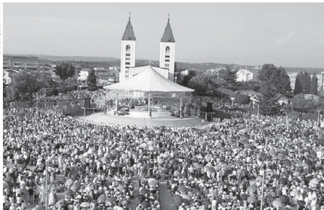
La reciente celebración del 25 aniversario de las apariciones congregó en Medjugorje a cientos de miles de peregrinos.

convertido para el mundo en instrumentos al servicio de María.